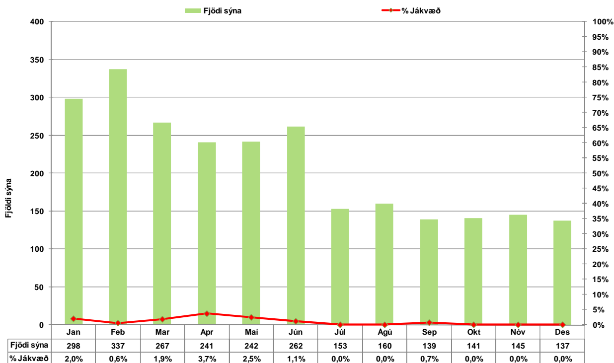
Mynd 2. Súlan sýnir fjölda sýna en línan hlutfall jákvæðra sýna ( Salmonella greinist í sýni ).